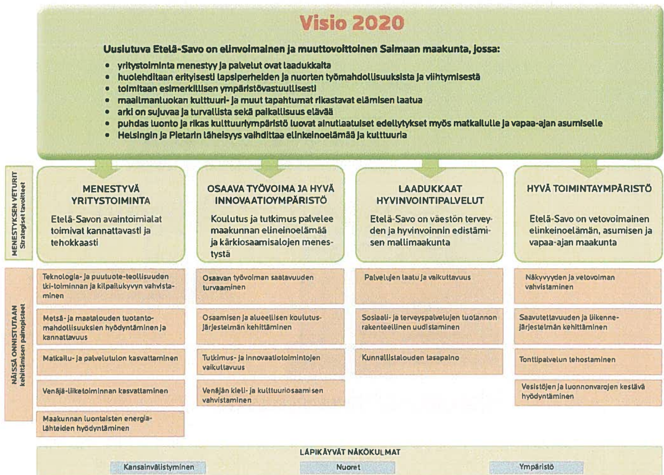
Kuva: Uusiutuva Etelä-Savo 2020 -maakuntastrategia

Maakuntaohjelmaa valmistellaan vuorovaikutteisessa kaikille avoimessa yhteistyöprosessissa. Valmistelua ohjaa ja yhteen sovittaa sihteeristö, johon kuuluu maakuntaliiton ja ELY-keskuksen asiantuntijoita. Ohjelman sisältöä ja toimenpiteitä valmistelemaan kootaan neljä työryhmää eli valmistelufoorumia. Foorumeihin kutsutaan kattavasti viranomaisien, yritysten, yhteisöjen ja järjestöjen edustajia. Ohjelman